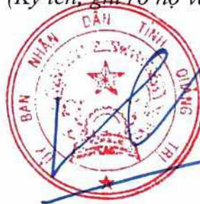
PHÓ CHỦ TỊCH UBND TỈNH Hà Sỹ Đồng

(Ký tên, ghi rõ họ và tên, đóng dấu cơ quan)